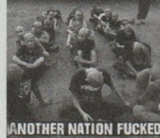
ANOTHER NATION FUCKED